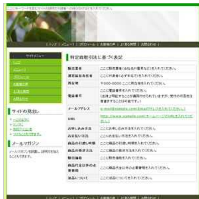
特定商取引法に基づく表記