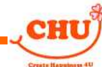
入居までの流れの説明ページ