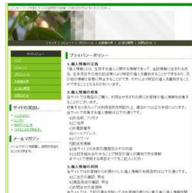
プライバシーポリシー