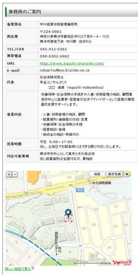
事務所案内のページ