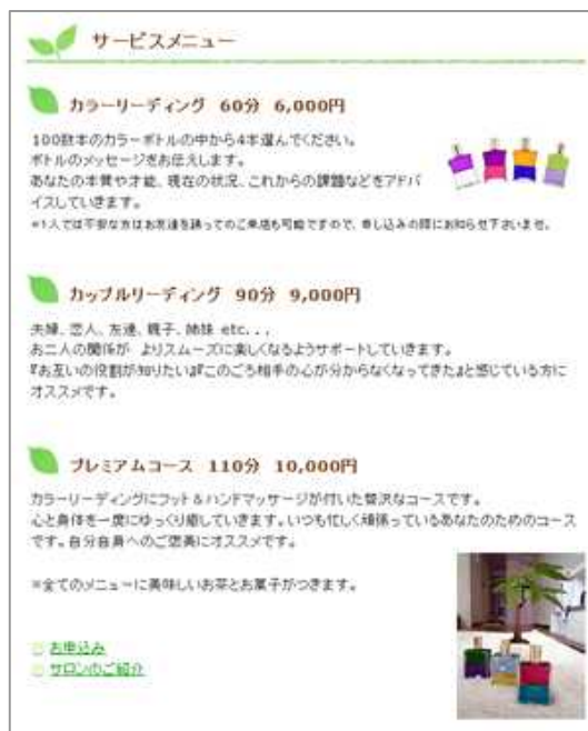
サービスメニューのページ

オーラソーマ カラーヒーリングスペース 『Jasmine(ジャスミン)』様のサイト http://www.aura-soma-jasmine.com/