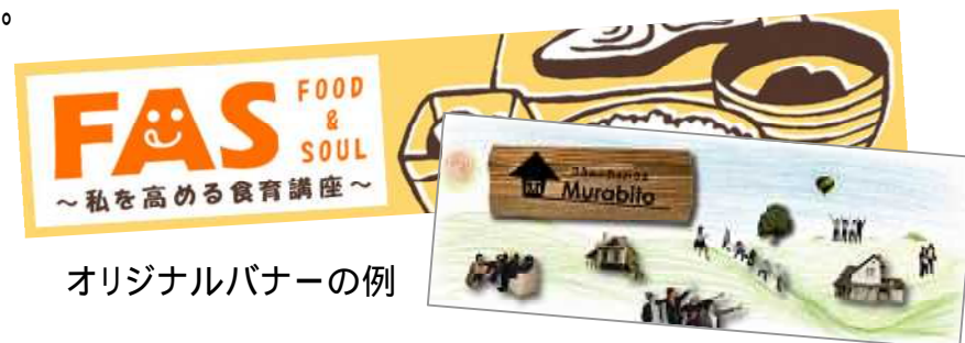
オリジナルバナーの例