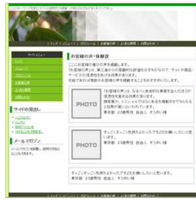
お客様の声・体験談