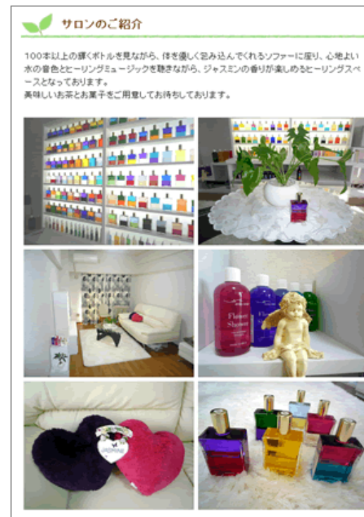
サロン紹介のページ

オーラソーマ カラーヒーリングスペース 『Jasmine(ジャスミン)』様のサイト http://www.aura-soma-jasmine.com/