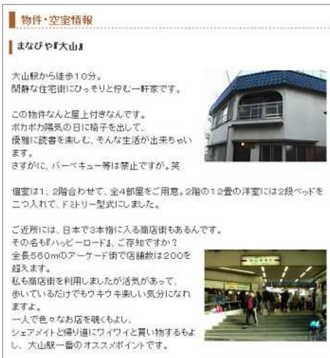
物件情報のページ

Murabito株式会社様のサイト http://www.murabito.co.jp/